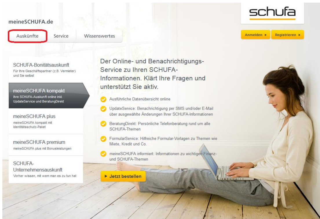
Abbildung 1: Auskünfte meineSCHUFA

Um dort zur kostenlosen Selbstauskunft zu gelangen, klicken Sie auf der Startseite auf „Auskünfte“ (Abbildung 1).